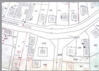
Katastarski plan 1977.

Na području katastarske općine Lipik (Grad Lipik) 1977. godine izvršena je katastarska izmjera i katastarsko klasiranje zemljišta. Podaci dobiveni izmjerom izloženi su na javni uvid nositeljima prava na nekretninama u razdoblju od 1977. do 1980. godine. Na temelju prikupljenih podataka izrađen je katastarski operat za katastarsku općinu Lipik, koji je stavljen u službenu uporabu rješenjem Republičke geodetske uprave.