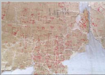
Katastarski plan 1915.